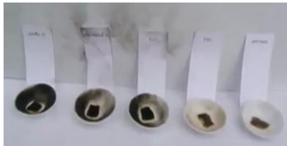
ภาพที่ 2: การเปรียบเทียบเขม่าที่เกิดจากการเผาไหม้ของน้ำมันแต่ละชนิด

เบื้องต้นร่วมกับนักเรียนว่า น้ำมันเป็นเชื้อเพลิงที่นักเรียนใช้อยู่ในชีวิตประจำวัน จากนั้น เธอจึงอภิปรายเกี่ยวกับชนิดของน้ำมันในท้องตลาด (เช่น เบนซิน 91 เบนซิน 95 แก๊สโซฮอล์ 91 แก๊สโซฮอล์ 95 E10 E20 และ E85) และตั้งประเด็นคำถามให้นักเรียนหาคำตอบว่า “น้ำมันเบนซินกับแก๊สโซฮอล์ อย่งไหนคุ้มค่าน่าเติมกว่ากัน” นักเรียนได้ทำการทดลองเกี่ยวกับสมบัติของน้ำมันแต่ละชนิด ทั้งโดยการเผาเพื่อเปรียบเทียบปริมาณเขม่า (ดังภาพที่ 2) และการวางน้ำมันทิ้งไว้ในภาชนะเปิดที่อุณหภูมิห้องเพื่อเปรียบเทียบอัตราการระเหย (ดังภาพที่ 3) ด้วยหลักฐานเหล่านี้ร่วมกับข้อมูลอื่น ๆ เช่น ราคาน้ำมัน ประเภทของเครื่องยนต์ และผลกระทบต่อสิ่งแวดล้อม นักเรียนจึงร่วมกันอภิปรายว่า น้ำมันชนิดใดคุ้มค่าต่อการเลือกใช้มากที่สุด